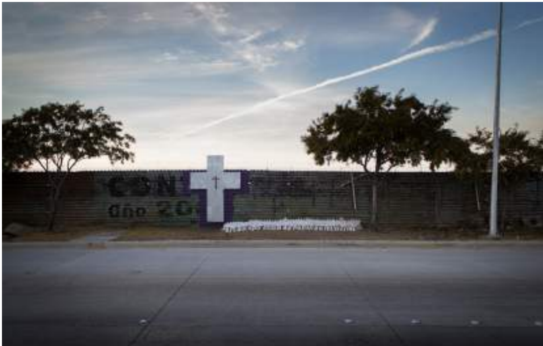
Frontera mexicana en Tijuana

Por ejemplo, las muertes de migrantes registradas en el condado de Pima, en el desierto de Arizona, desde que Trump fue elegido presidente, entre noviembre de 2016 y abril de 2017, son casi el doble que las registradas en ese mismo periodo un año antes. 58