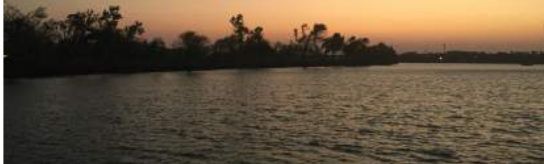
Río Grande en Reynosa, Tamaulipas, que divide Estados Unidos de México.

Comentario de un trabajador social de un albergue para personas migrantes en Nuevo Laredo, estado de Tamaulipas, México, a través de la frontera desde el punto fronterizo de aduana de Laredo, Texas.